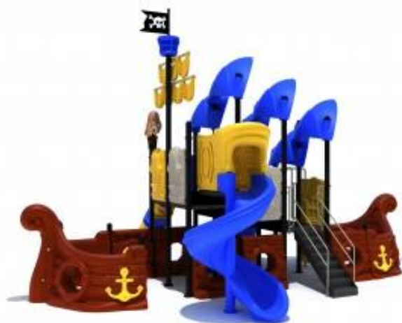
Widok nr 2