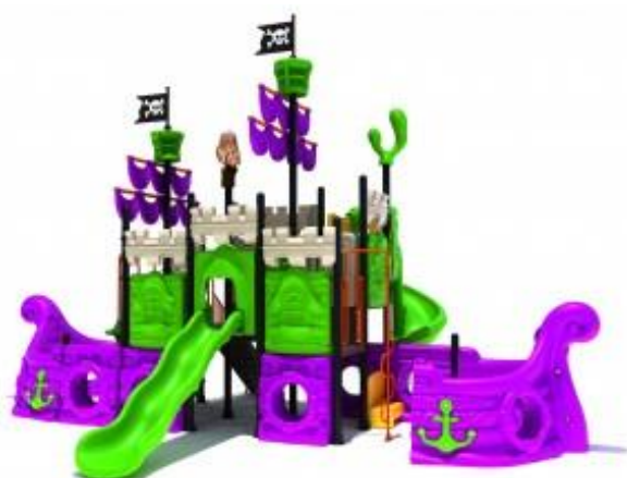
Widok nr 2