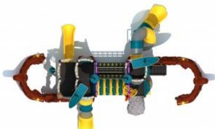
Widok nr 2