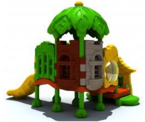
Widok nr 1