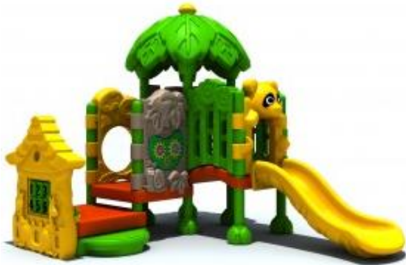
Widok nr 2